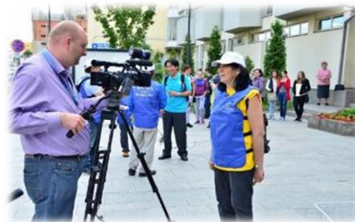
Colectarea feedbackului participanților