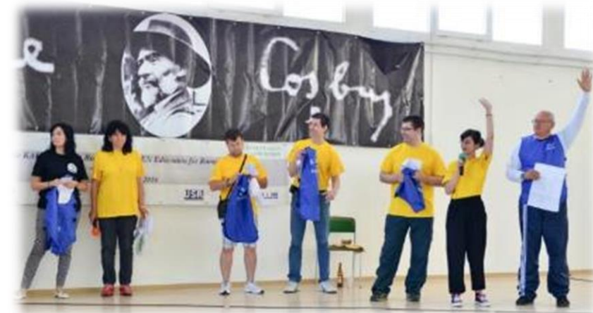
Organizarea pe echipe