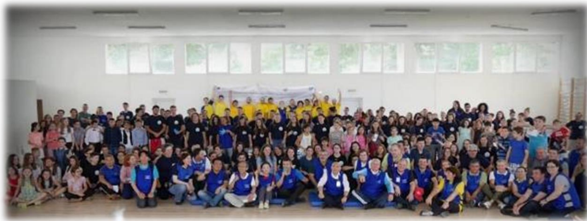
Poză de final