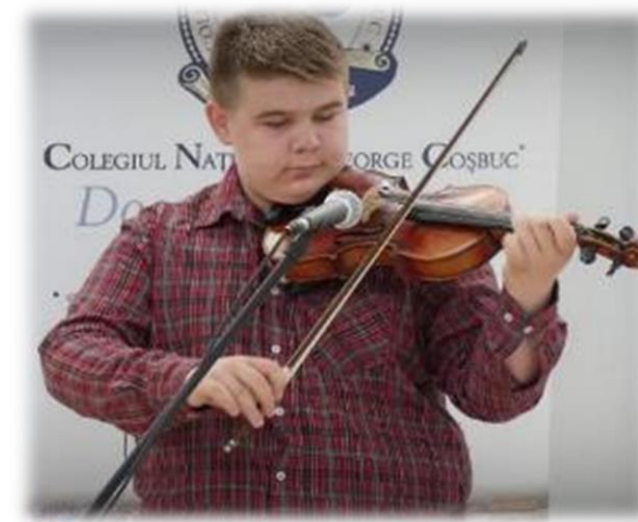
Moment artistic al elevilor Colegiului Național "George Coșbuc", Cluj-Napoca